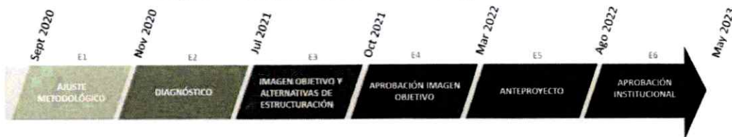
Figura 3: Esquema de la cronología del estudio

El plazo estimado para la elaboración y aprobación, vale decir, para diseñar y posteriormente sancionar el instrumento de planificación, está regido según contrato para el desarrollo de los productos y sus modificaciones. Se distribuye en 6 etapas de trabajo, de acuerdo a la descripción en la siguiente figura: